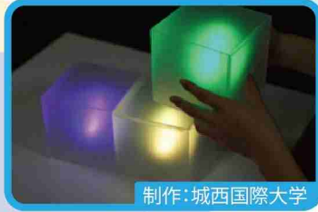
制作：城西国際大学 ブロード Broad

「色の光で遊ぶ」がテーマの作品です。カラーライト型デバイスで照らすと、音と共に同じ色に反応します。