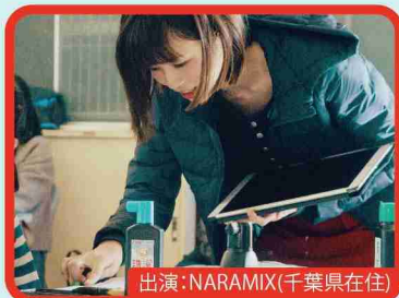
出演：NARAMIX(千葉県在住) 黄昏れ海の鳥獣戯画

●場所：千葉ポートパーク円形広場ステージ ●時間：期間中の土日 17:00～17:30