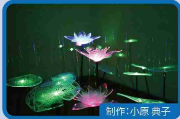
制作：小原 典子 ロータスランド LOTUS LAND-CHIBA

鳥の翼をモチーフにした7色に光るLEDアート作品。自然豊かな千葉に集まる野鳥達を表現しています。