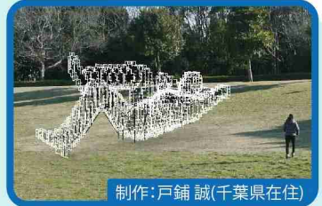
制作：戸舗 誠(千葉県在住) 空を眺めている人

海をモチーフにした、幅約10mのプロジェクションマッピング。触れると千葉の海の生き物に出会えます。