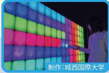
制作：城西国際大学 ピコル pixcol

「ちば文化資産」をテーマにご応募頂いた絵画・写真作品約500点を展示します。それぞれの作品のエピソードとともにお楽しみください。