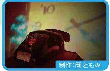
制作：岡ともみ 千葉の内緒話

「未来をプログラムする」がテーマの作品です。光るブロックの縦横の配置によって色や音が変わります。