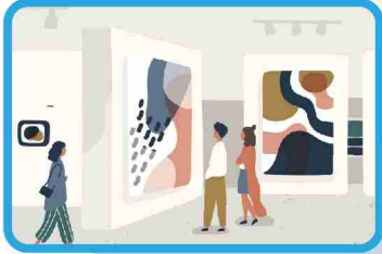
絵画・写真公募展

●場所：県立美術館 第7展示室 ※休館日：8月19日(月) ●時間：9:00～16:30