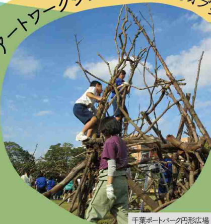
千葉ポートパーク円形広場

ワークショップの申込方法など 詳細は「ちばアート祭2019」 公式HPでご確認ください。