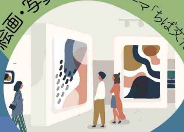
千葉県立美術館 第7展示室