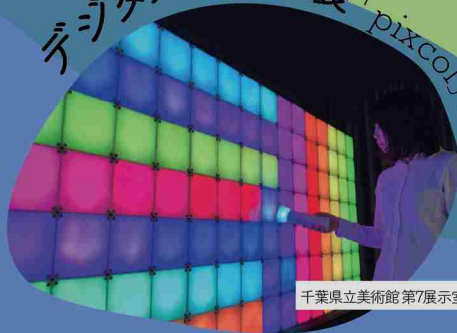
千葉県立美術館 第7展示室