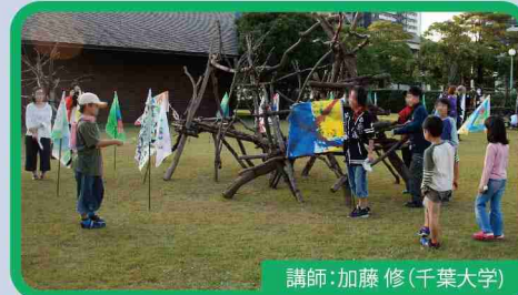
講師：加藤 修(千葉大学) 住みたい国を思い描き、旗をつくる

●日時：8月17日(土)16:00～18:00 8月24日(土)10:00～12:00