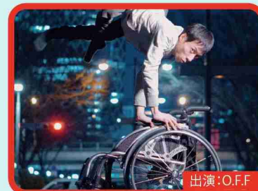
出演：O.F.F. クルマイス×ダンス

車椅子ダンサー「かんばらけた」率いるダンスユニット「O.F.F」による即興ダンスパフォーマンス。