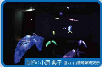
制作：小原 典子 協力：山階鳥類研究所 鳥の交差点-CHIBA

●場所：千葉ポートパーク円形広場 ※「光る海の探索」以外の作品は、 ●ライトアップ時間：18:00～20:50 期間中、終日展示しています。