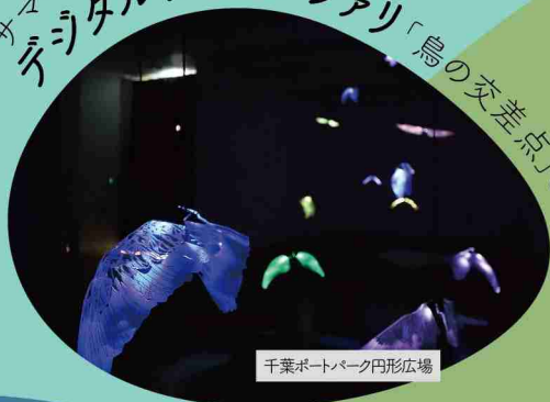
千葉ポートパーク円形広場